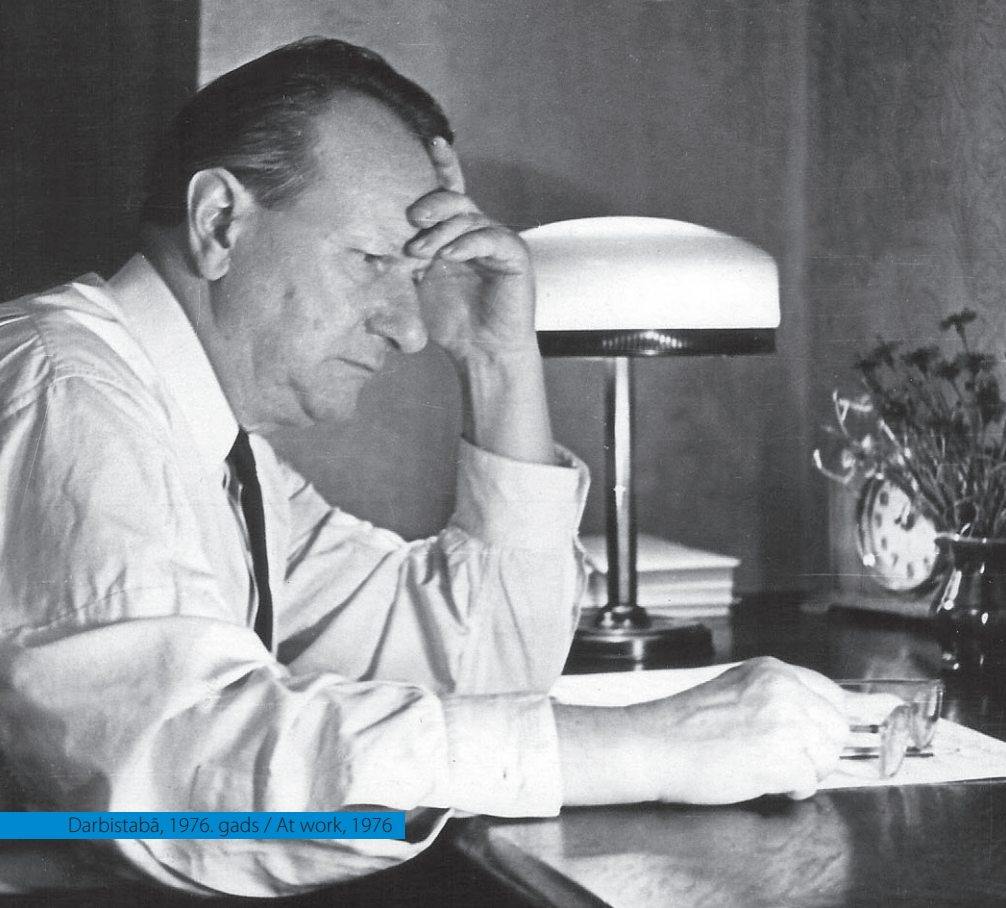
Darbistabā, 1976. gads / At work, 1976